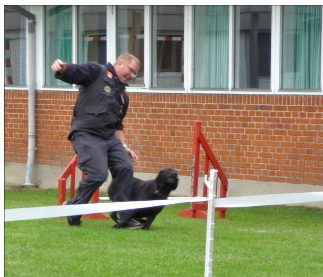
Formanden og hans hund lavede et ”stunt” - de genfandt dog begge hurtigt balancen igen.