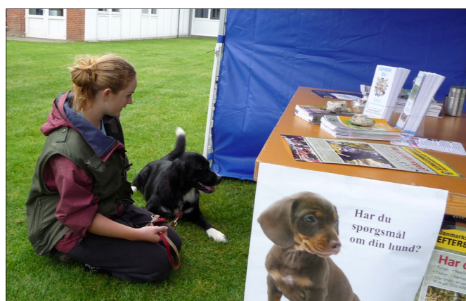
Hyggestund mellem strabadserne

Det var en god dag med masser af miljøtræning for vore hunde, og forhåbentlig god reklame for DcH Thyholm.