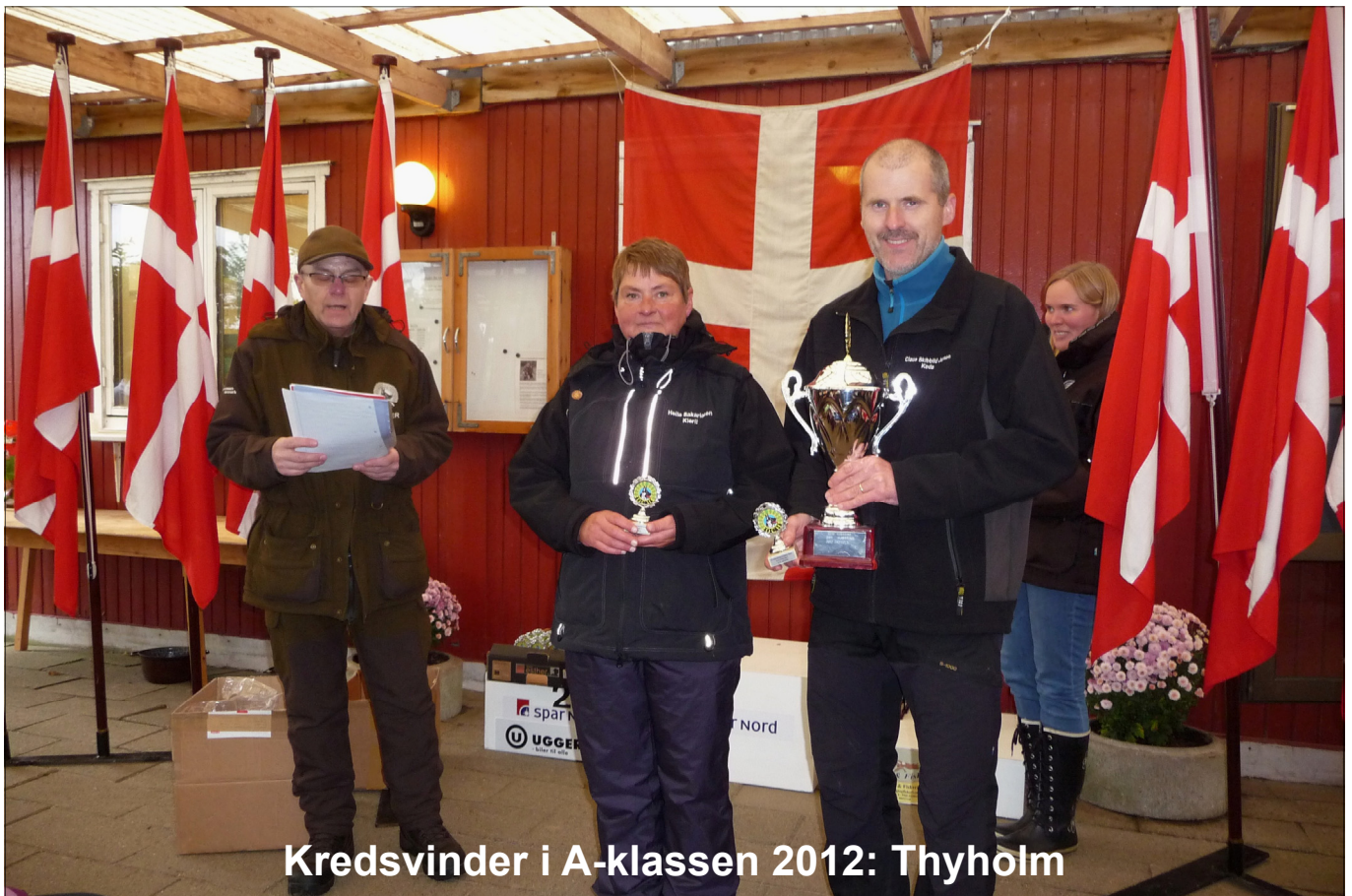
Kredsvinder i A-klassen 2012: Thyholm