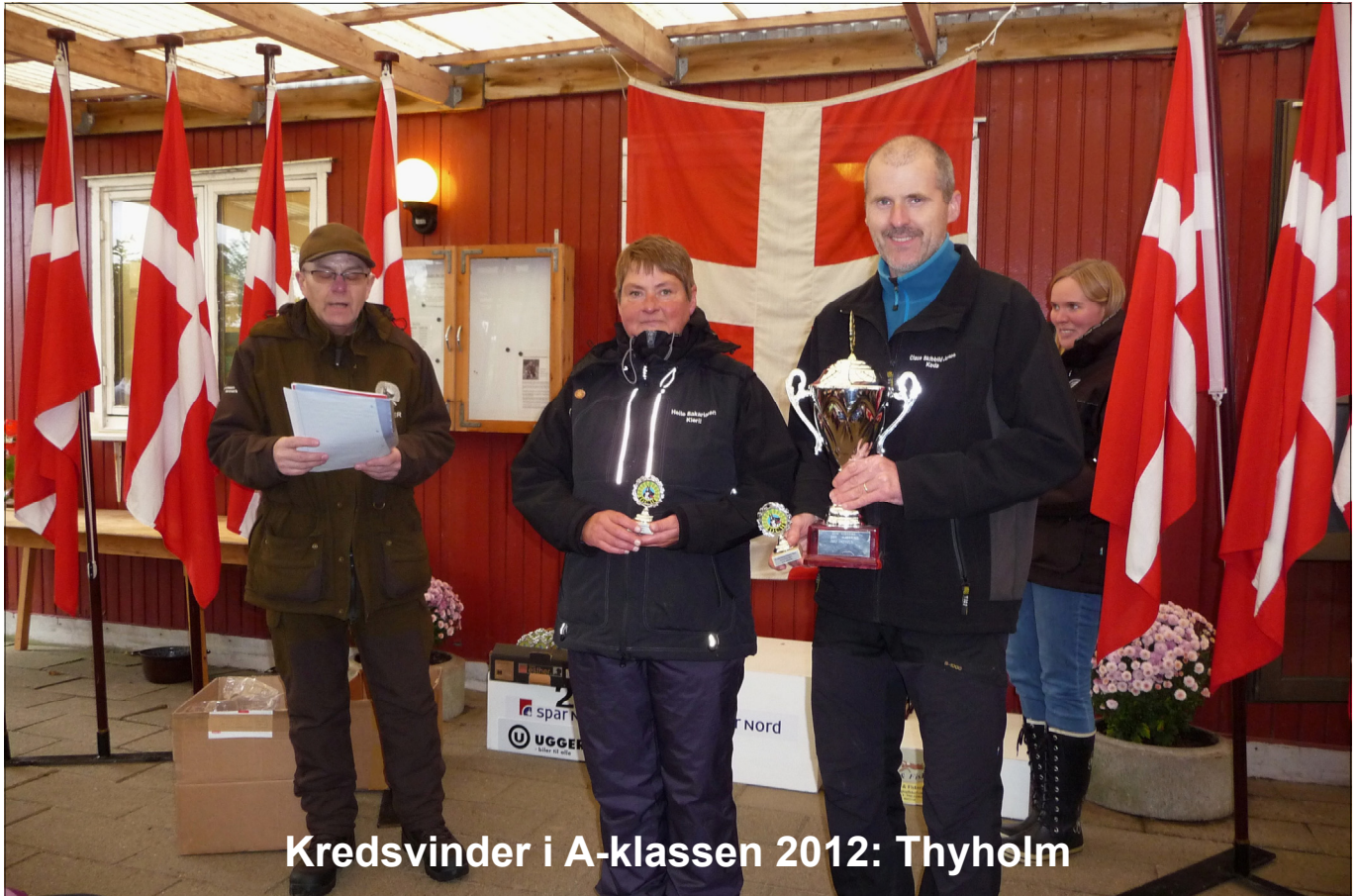
Kredsvinder i A-klassen 2012: Thyholm

DcH Frederikshavn var d. 13/10 vært for sidste kredskonkurrence. Her skulle kredsvinderen og kredsmesteren kåres, og Thyholms føring i A klassen kunne ikke røres.