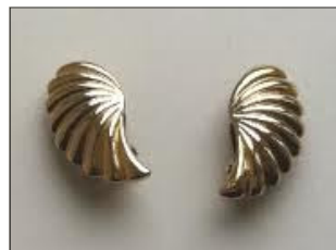
Per og Beauty

Jeg fik ikke taget billede af dem, men det er i lig med disse.