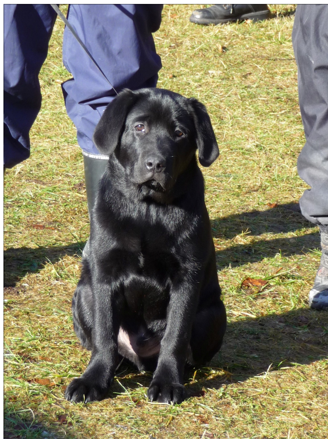
En kommende E hund måske?

Et par børn i børnehavealderen løb og legede i skoven, og de skulle vide, hvad vi lavede. De fortalte om deres egne hunde, og pigen kom med dagens bemærkning: