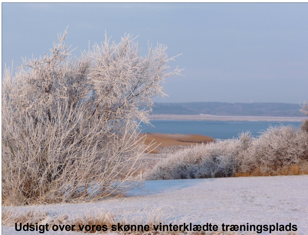
Udsigt over vores skønne vinterklædte træningsplads