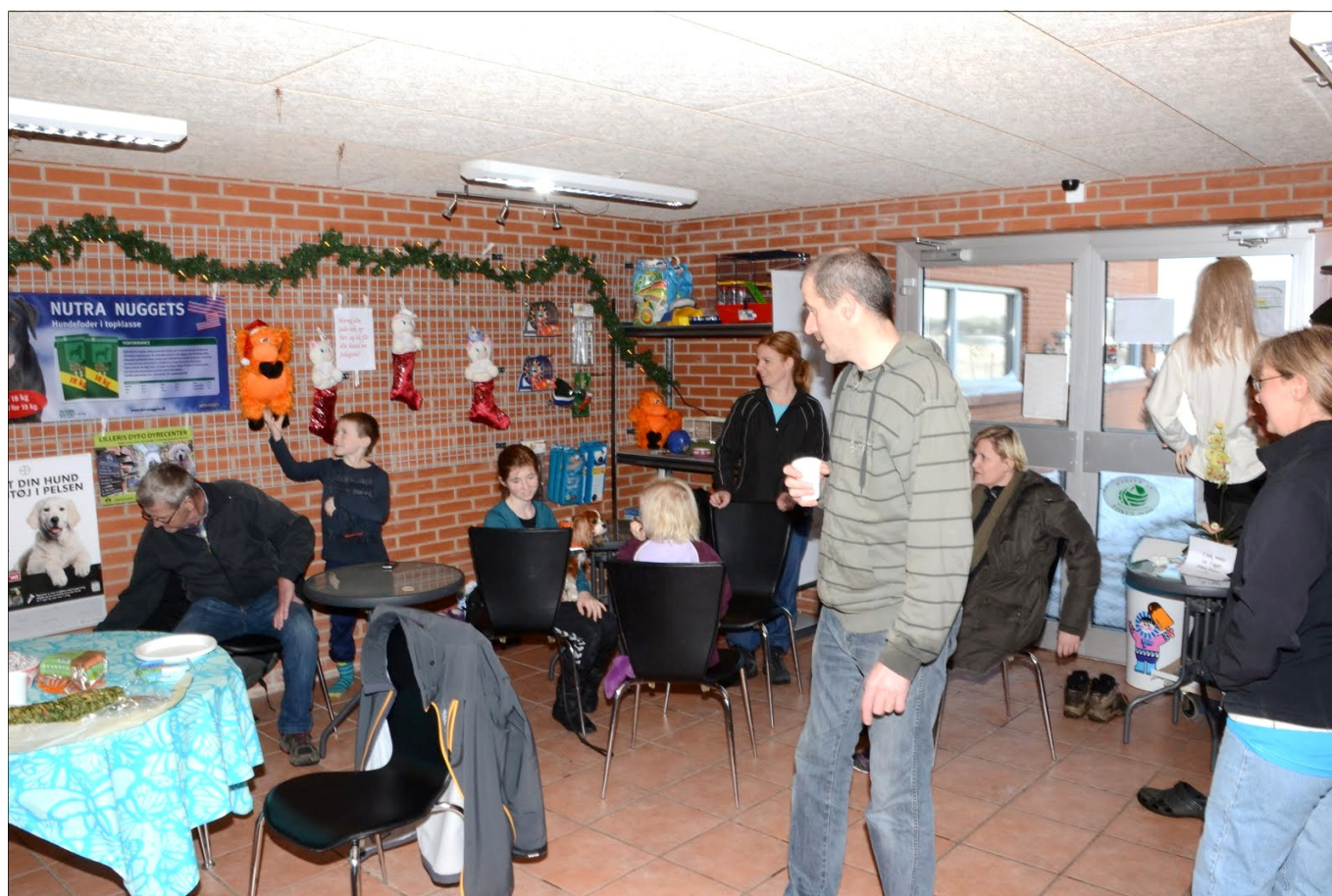
Dagen sluttede med hyggeligt samvær.

Efter nogle hyggelige timer satte vi kursen hjemad igen, nogle dejlige ople- velser rigere.