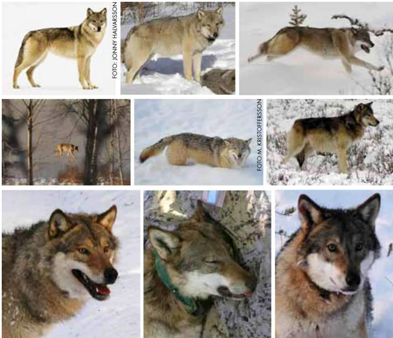
Svenske ulve i vinterpels.

altid opretstående. Ulvens ører sidder højt og tæt på kraniet.