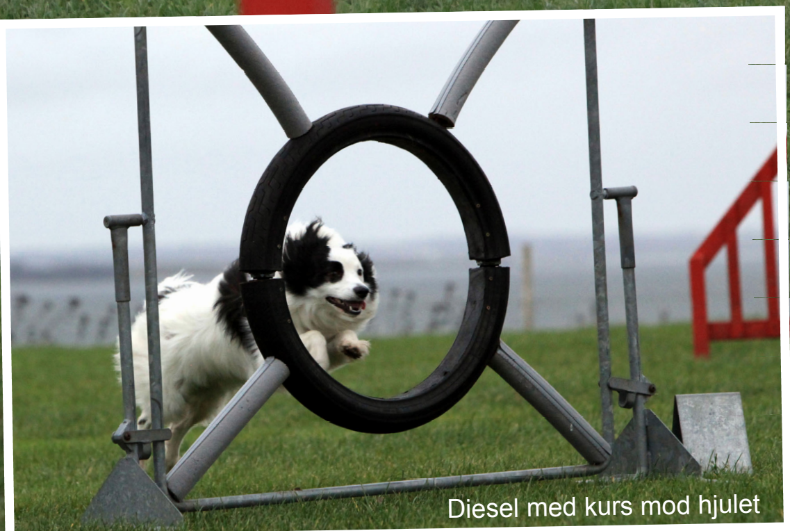
Diesel med kurs mod hjulet