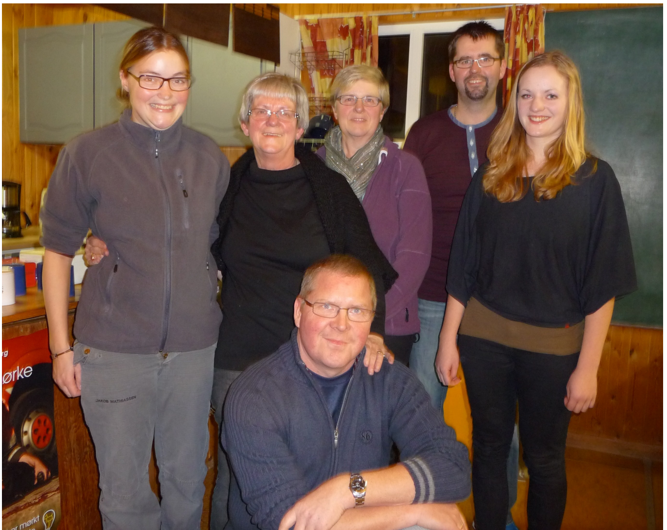
Dch Thyholms nye bestyrelse