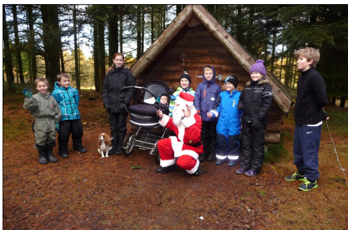
Børnene samlet omkring julemanden