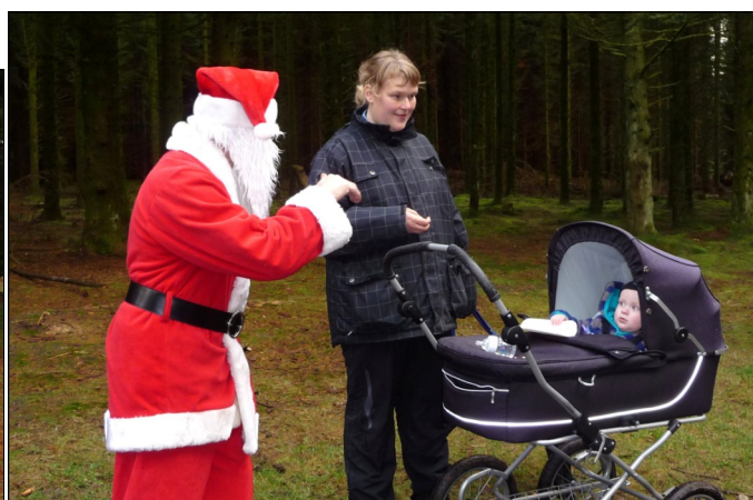
Arnold kigger lidt betuttet på den underlige mand.

Der var dømt hygge med kakao og æbleskiver.