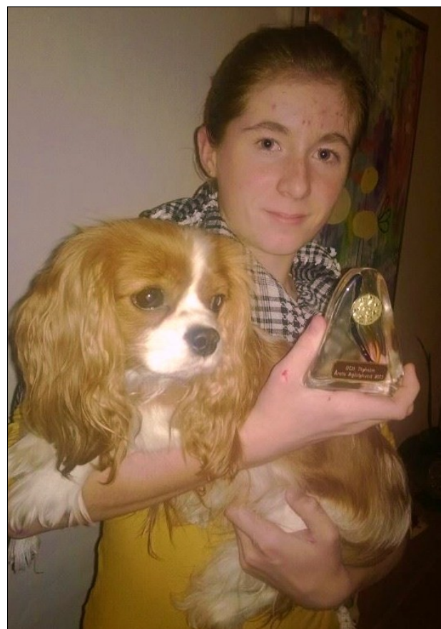
Freja blev årets agilityhund