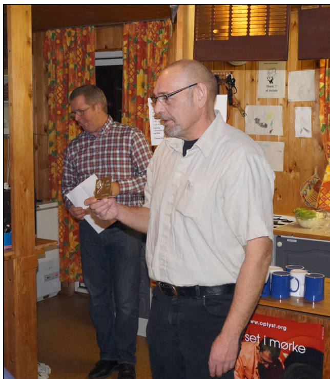
Bent blev årets B hund