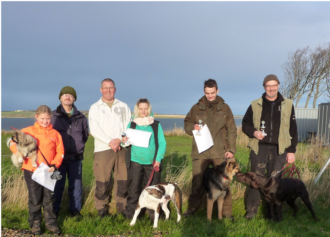
Dygtige deltagere ved prøve på begynderholdet