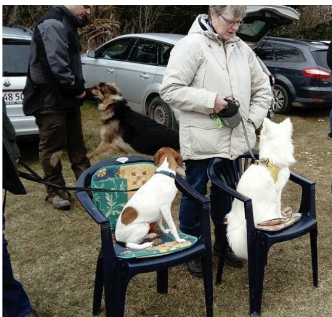
Et lille vov fra LIV.